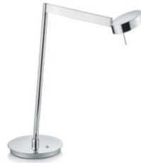
61.621.xx Tischleuchte / table lamp 11 W LED, 2.700 K, 1288 lm energy efficiency class E