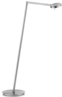
41.967.xx Stehleuchte / floor lamp 11 W LED, 2.700 K, 1288 lm Energieeffizienzklasse E